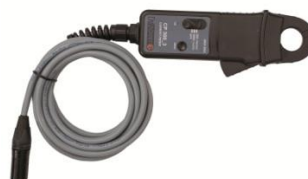
Pinces de courant 30/300 A avec extension 5 m