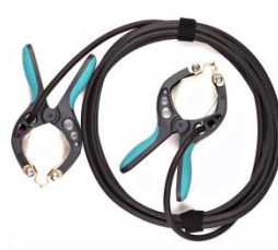
Câbles de branchement de courant avec pinces TTA