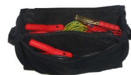
Sac pour câbles