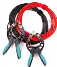
Câbles détecteurs de tension avec pinces TTA