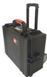
Coffre en plastique pour câbles avec roues