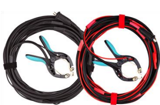
Câbles de courant et câbles détecteurs de tension avec pinces TTA

Les spécifications sont valables si l'instrument est utilisé avec l'ensemble d'accessoires recommandé.