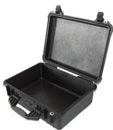
Coffre en plastique pour câbles